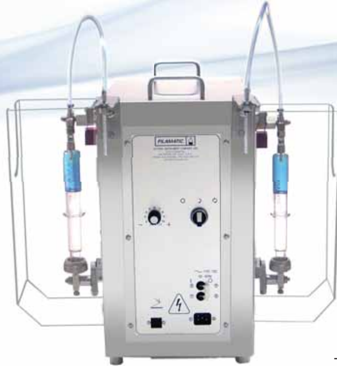
DAB Series – Máquina para Trabajos Medianos